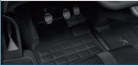
KOMPLET PRZEDNICH DYWANIKÓW GUMOWYCH Z LOGO PEUGEOT