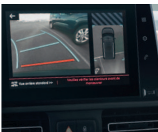
PAKIET VISIOPARK & FLANKGUARD