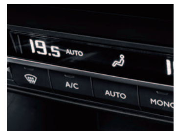
KLIMATYZACJA AUTOMATYCZNA DWUSTREFOWA