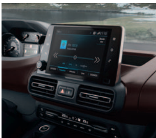
PEUGEOT CONNECT RADIO