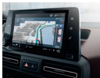
PEUGEOT CONNECT NAV DAB