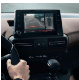
PAKIET PARK ASSIST