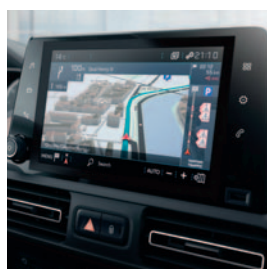
PEUGEOT CONNECT NAV DAB