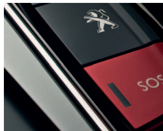
SYSTEM PEUGEOT CONNECT SOS & ASSISTANCE