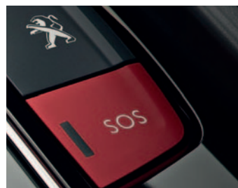
SYSTEM PEUGEOT CONNECT SOS & ASSISTANCE