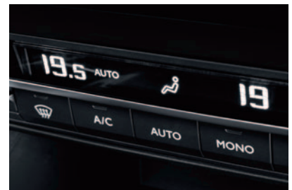
KLIMATYZACJA AUTOMATYCZNA DWUSTREFOWA + PAKIET WIDOCZNOŚĆ